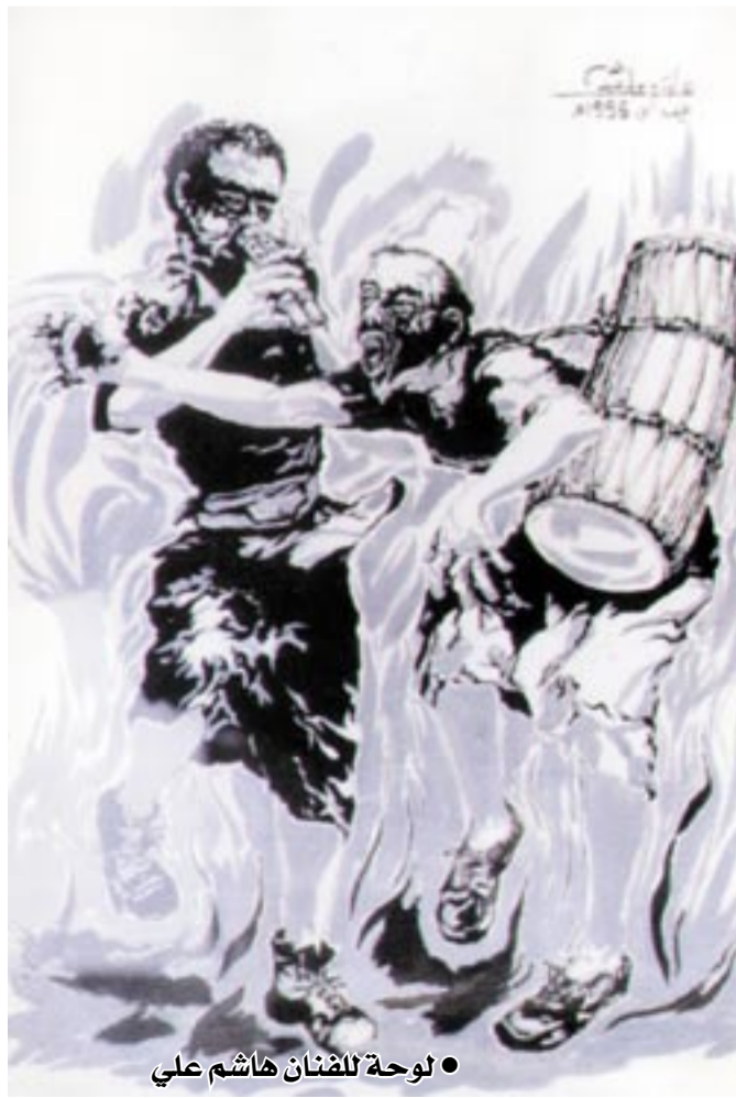
• لوحة للفنان هاشم علي

في مجتمع النمل، يارفيق، لا يحرق أحد مسرحاً، كحالتك، أو يُلغق دار نشر. لن يأتي إليك «وفد» من القوات اللبنانية،