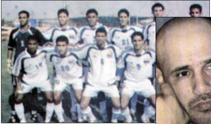
● المنتخب الأولمبي