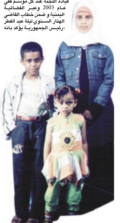
● أطفال الريدي.. انتظار ممل

الجمهورية كسجناء ذمة مالية مستحقين، قال ملتقى أسر السجناء إنه لم يختلف عن سابقه من البيانات بجديد سوى بهامة قضائية جديدة للمشاركة في المعتكك التضليلي بضمن بخص، وأردف معدداً بعض تصريحات أعضاء اللجنة على مدار السنوات الماضية، بدءاً بتصريح رسمي للنائب العام عبدالله العلفي في صحيفة «الميثاق» في 9 مايو 2005 جاء فيه: «وحسب توجيهات رئيس الجمهورية، سوف يتم إطلاق سراح جميع سجناء الحقوق الخاصة»، وقبله تصريح آخر لعمود الهتار في جريدة «الوحدة» عام 2004 يفيد بأن «هذا العام ستتم أكبر عملية إفراج على مستوى الجمهورية تشمل من عجزوا عن سداد مديونياتهم»، واسترسل بيان ملتقى أسر السجناء في سرد تصريحات قيادات اللجنة عند كل موسم فني عام 2003 وعبر القضائية اليمنية وضمن خطاب القاضي الهتار السنوي ليلة عيد الفطر رئيس الجمهورية يؤكد بأنه