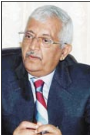
• د. ياسين سعيد نعمان

نظراً لخبرته الطويلة والواسعة بالنظام، بل لا أظن أن أحداً قد فوجئ بالنتيجة، وأنا شخصياً لم أفاجأ بها على الإطلاق وقد سبق أن أشرت إلى النتيجة المتوقعة قبل الانتخابات في مقالات نشرت في أكثر من صحيفة، والشئ المثير هنا والذي لا أجد له تفسيراً هو أن الدكتور ياسين بعد أن يسرد كل الخروقات التي صاغت النتيجة والتي كانت متوقعة بحلول فجأة إلى مدافع عن مشاركة المعارضة في صياغة تلك النتيجة، تحت مبرر أن المعارضة تعتبر نفسها مسؤولة عن إنقاذ اليمن من أن تتحول إلى دولة فاشلة، بل إنه أكثر من ذلك يطالب النظام بدفع ثمن للمعارضة لقاء هذه الخدمة التي قدمتها. ولست أدري ما الثمن الذي يريد؟! لا أظن أن الرجل يخلط بين اليمن والنظام، فمن هو يمثل وعي الرجل وتفكيره لا تختلط عليه الأمور إلى هذا الحد، لكن الشئ المؤكد هو أن المعارضة لم ولن تتحول دون تحول اليمن إلى دولة فاشلة، فسياسات النظام الذي أضفت عليه المعارضة طابع المشروعية تدفع اليمن دفعا نحو تلك النهاية المتوقعة، بل إن المعارضة بمشاركتها في تلك المهزلة التي سميت انتخابات لم تفعل أكثر من أن أضفت على الفاشل والمخرب ثوب المشروعية وغطاها ليكمل عملية التخريب التي يسير فيها باطمئنان بعد أن حررت من أزمة المشروعية. وما أتوقعه من الآن، ومؤشرات ذلك بادئة عياناً، هو أن