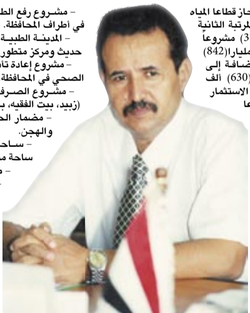
• محمد صالح شملان - محافظ الحديدة

- مشروع رفع الطاقة الإنتاجية لمياه التغذية في أطراف المحافظة. - المدينة الطبية وتحتوي على مستشفى حديث ومركز متطور للغسيل الكلوي. - مشروع إعادة تاهيل وتوسعة شبكة الصرف الصحي في المحافظة. - مشروع الصرف الصحي للمدن الثانوية (زيد، بيت الفقيه، باجل). - مضمار الحسينية الدولي للفروسية والهجن. - ساحة 22 مايو، للعروض وهي ساحة متعددة الأغراض. - محطات الرحلات المركزية. - المدينة الرياضية. كما تهدف قيادة المحافظة إلى بناء المصايف ونسق استراتيجية رقمية من خلال توفير التكنولوجيا وربط جميع المرافق الحكومية ومؤسسات القطاع العام بشبكة إلكترونية حديثة يسهل الحصول من خلالها على كل المعلومات التي ستكون متاحة للجميع.