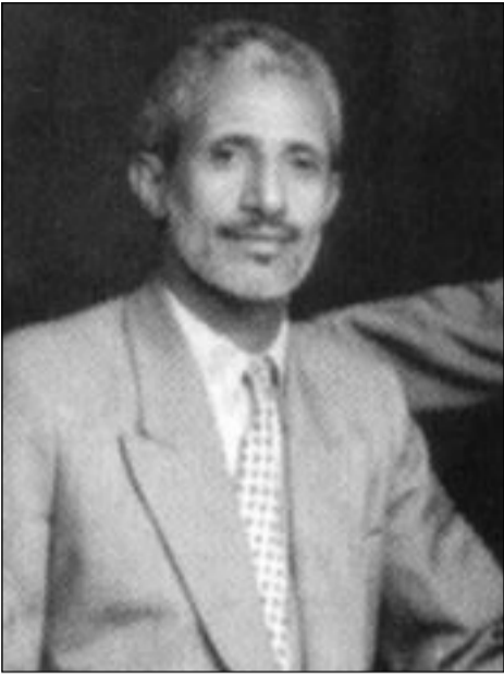
• الاستاذ النعمان

والاستبداد والشمولية؛ وهو ما قاده إلى السجن في مصر عبدالناصر وإلى التجريد من الجنسية والحرمان من حق المواطنة في نظام كان هو أحد بناته والداعين إليه. ومن يقرأ خطباته التي نشرتها "النداء" والوسط، والموجهة إلى رفاقه في الدولة الثورية، يدرك عمق إنسانية هذا الداعية العظيم الذي ظلمه أهله.