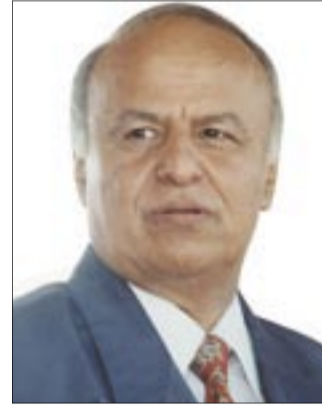
• عبدربه منصور

الامر مفروغ منه.. دون ان يُنسب هذه المرة تصريحات للمسؤول الأمريكي يؤكد فيها على ضرورة اقامة الانتخابات في موعدها، وهي التصريحات التي كان كامبل يحرص على نفيها خلال مسعى الوساطة السابق..