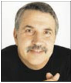
بقلم: توماس فريدمان

والجامعات والشركات الصينية للمشاركة في تدفقات المعرفة العالمية الكبرى، وخصوصاً تلك التي لها صلات جيدة بعيداً عن القطاع القائم وحدود السوق. لكن يبدو للأسف أن الصين تراهن على أنها قادرة على التوجه بميول ثلاثة، ألا وهي السيطرة على التدفقات لدواعٍ سياسية، والمحافظة على مصانع الصين التحكيمية المستندة إلى نموذج القرن العشرين لدواعٍ خاصة بالتوظيف، وتوسيع الصين الشبكية المستندة إلى نموذج الحادي والعشرين لدواعٍ تتعلق بالنمو. إلا أن التناقضات ضمن هذا التوجه قد تقوض الميول الثلاثة، وعندئذٍ يصبح نموذج التحكم الخاص بالقرن العشرين تحت الضغط. فالمستقبل ملك الذين يعززون تدفقات معرفة أغنى وأكثر تنوعاً، ويطورون المؤسسات والممارسات اللازمة لحمايتها. باختصار، تعمل الصين التحكيمية، التي تريد فرض رقابة على "غوغل"، ضد الصين الشبكية التي تزدهر بفضل "غوغل". وإلى الآن يبدو أن رغبة الصين التحكيمية هي التي ستسود. وإن حصل ذلك، فإود أن أبيع الحزب الشيوعي على المكشوف.