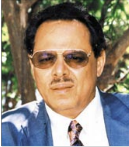
● علي ناصر محمد

– سبق أن عبرت عن عدم وجود ارتباط بين القضيتين وقلت بأنه لا توجد علاقة ذاتية بين القضيتين، ولكن قد تتقاطعان في جزئية معينة ضمن علاقة موضوعية، وأن قضية الحوثيين في المقابل تفتقر كثيراً عن قضية الجنوب من حيث خلفياتها وتداعياتها، كما أن لغة السلاح هي اللغة الأبرز بين السلطة والحوثيين وذلك نتيجة لطبيعة المناطق الشمالية وصعدة بالذات، فضلاً عن الملابس التي تلف قضية الحوثيين، والتي تعلمها السلطة أكثر منا، فهي قضية غامضة بامتياز، ويعبر عن ذلك السياسيون وحتى أعضاء مجلس النواب الذين ينبغي أن يمثلوا الشعب ويحاسبوا الحكومة فهم يجهلون تفاصيلها، أما القضية الجنوبية فهي قضية لا يلفها أي غموض، والوضوح عنوانها وجوهرها، كما أن الحراك الجنوبي الذي يتحرك من وحيها هو نضال سلمي بالطرق المشروعة والمتعارف عليها في كل النظم والقوانين السارية، وإذا لجا مسؤولون كما أشرت في سؤالكم لعقد هذا الربط فهذا ينتظم في إطار ردود الفعل الإعلامية التي يتبعها هؤلاء المسؤولون عندما يضعهم الإعلام وخاصة الخارجي في مازق حرج، ولا نشعر بان