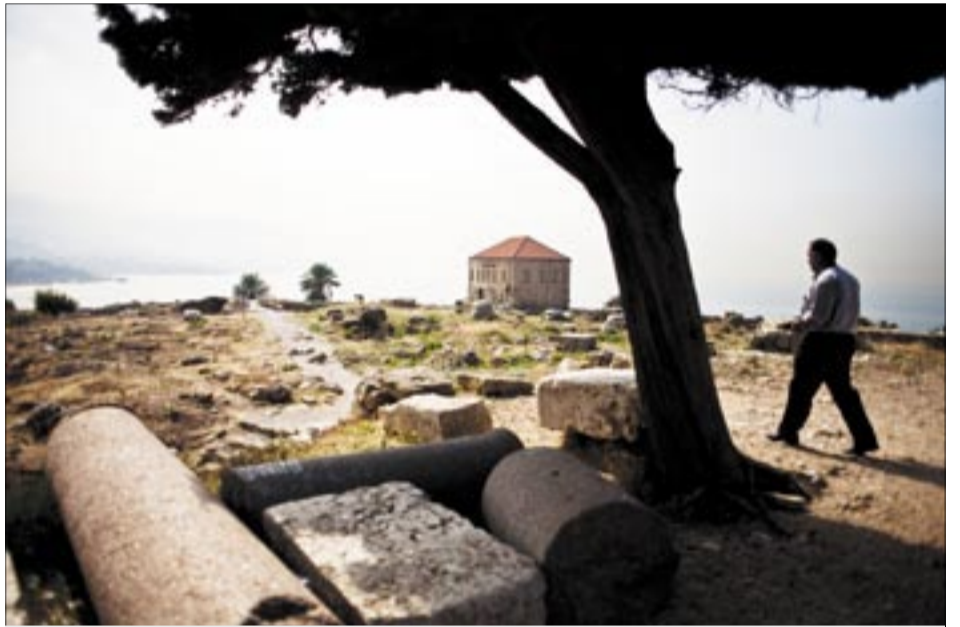
صورة للمنزل القديم في بيبيلوس، لبنان في تشرين الثاني (أكتوبر) 2009.