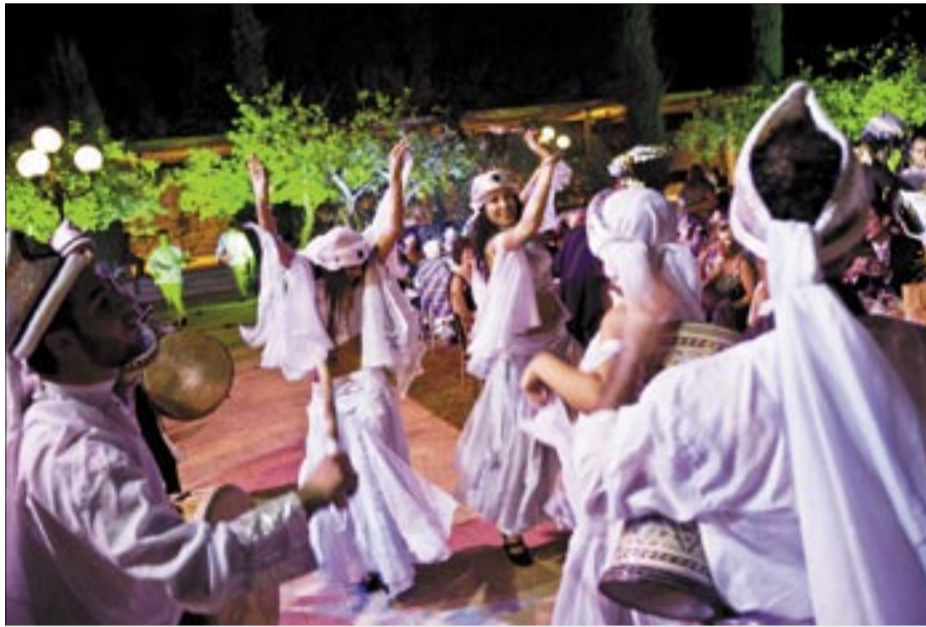
راقصون في عرس في منتجع "إده ساندز" في بيبيلوس، لبنان في تشرين الثاني (أكتوبر)، في ظل الحفاظ غير السهل على السلام، عاد السائحون إلى بيبيلوس منجنبيين إلى آثارها وإلى حياتها الليلية التي أعيد إحيائها.