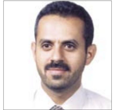
● الدكتور الراشدي

تأخير الدفن لإجبار الدولة على القيام بواجبها كان وسيلة ضغط ناجعة لإجبار السلطة والعقلاء على تقديم القتلة للعدالة وتسريع إجراءات التقاضي في القضايا التي يكون فيها الطرف المدان نافذاً، وكذلك قضايا القتل البشعة التي تثير غضب العامة، غير أن هذه الوسيلة لم تعد مجدية في السنوات