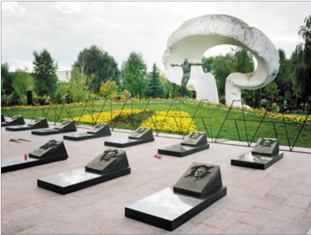
نصب تذكاري في مقبرة ميلتينو للأشخاص الذين توفوا أثناء قيامهم بواجبهم في تشرنوبيل.