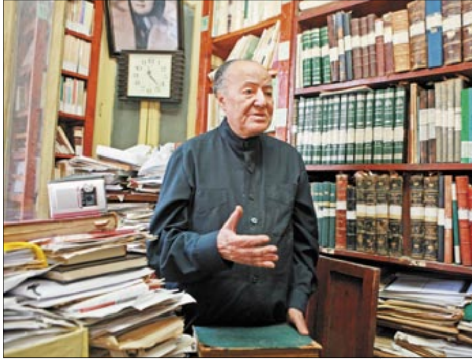
جمال البنا، ٨٨ عاماً، كاتب ديني، في القاهرة، في تشرين الأول (أكتوبر) عام ٢٠٠٦، صورة من الملف، وجد على الإنترنت جمهوراً واسعاً لأفكاره الإسلامية الليبرالية.