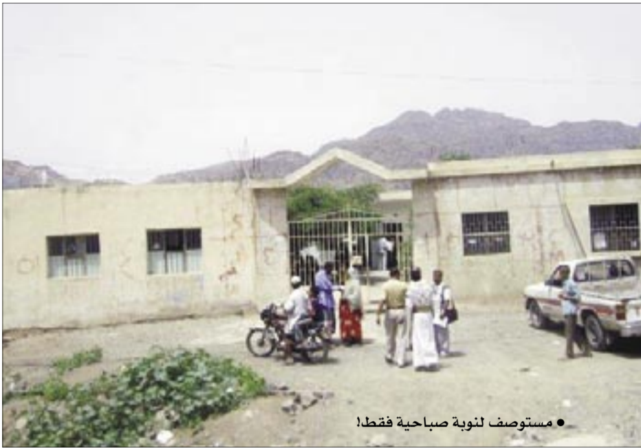
• مستوصف لثوية صباحية فقط