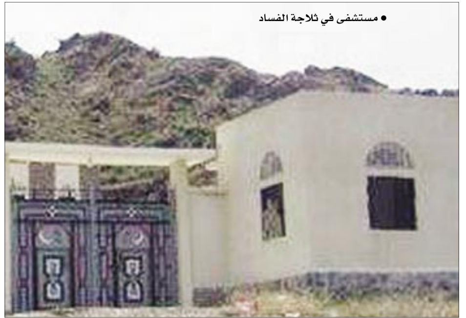
• مستشفى في ثلاجة الفساد