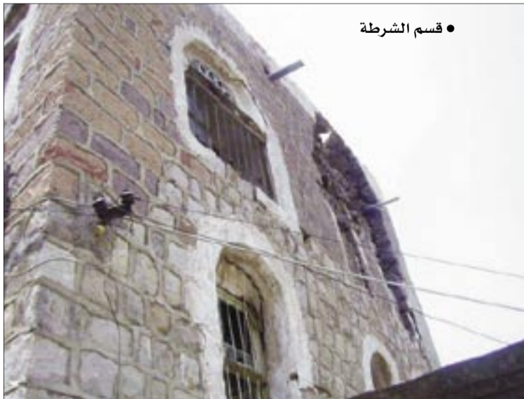
• قسم الشرطة