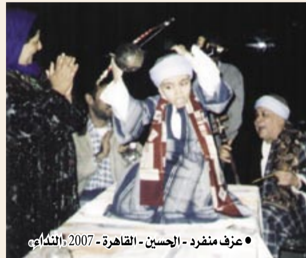
• عزف منفرد - الحسين - القاهرة - 2007