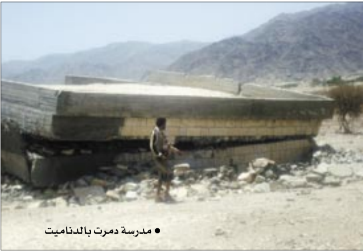
● مدرسة دمرت بالديناميت

■ متى يأمن الطلاب في شبوة على حياتهم ومستقبلهم؟ ■ المرأة.. منتهكة حقوقها.. وأولها حقها في التعليم..