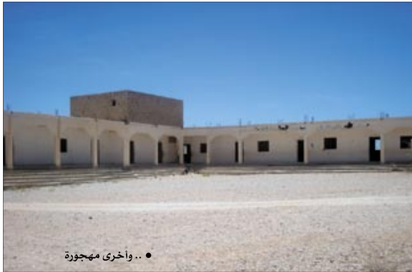
● ... وأخرى مهجورة

ومن ماضي الثأر وقصصه الواقعية، يوم إعلان النتائج النهائية للطلاب عاد أحدهم ويبيده شهادته فرحاً بنجاحه ملؤه السعادة، يسابق الزمن، يريد إدخال السرور إلى قلبي والده. وبينما هو يركض بتامل درجاته العالية تزين شهادته، سمع لعلعة الرصاص تملأ سماء قريته؛ لقد نشب نزاع بين أهله وآخرين. توقف، تأمل شهادته، ونظر بعين دامعة صوب منزله، سارع للاختباء خلف حجر كبيرة ظاناً أنها ستنجيه. لمح شخص يفيض نزاراً وثأراً. باغته برصاصات غدر سكنت جسده الطاهر، ليفارق الحياة متمسكاً بشهادته ودرجاته العالية.