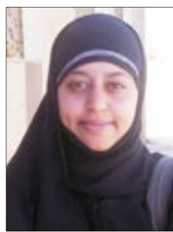
• شدى الحراري