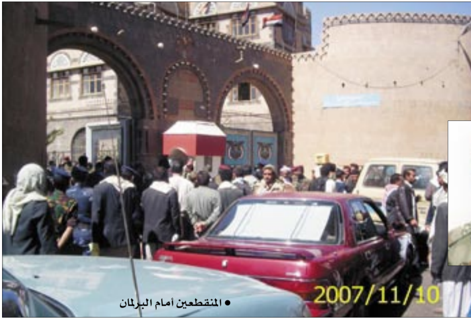
● المنقطعين أمام البرلمان