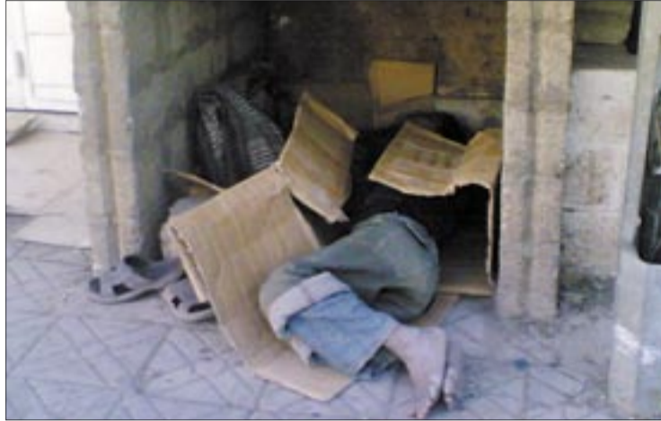
● سمير مستريحاً في عشه بعد مطاردة مضنية

الخاوية، والواضح أن اعتقاده الخاطي بنشوة اللحظة سيطر عليه طويلاً: إنه يأمل أن يكون أكثر نجاحاً لإيجاد شئ يأكله مع حلول المساء.