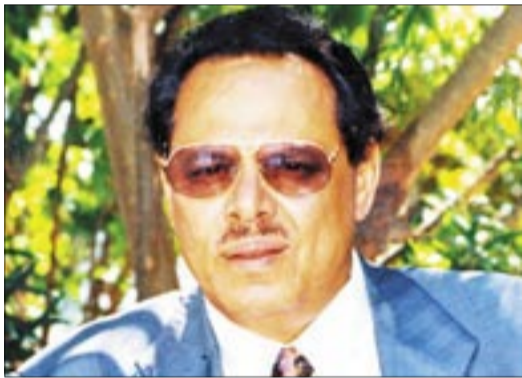
• علي ناصر

أدان بيان صادر عن مجلس تنسيق جمعيات المتقاعدين العسكريين والأمنيين وجمعيات جنوبية أخرى محاولتي اغتيال الرئيس السابق علي ناصر محمد في عاصمتين عربيتين، حسب ما أوردته تقارير صحفية مطلع الأسبوع الجاري. وقال البيان إن المحاولتين تشكلان منعطفاً خطيراً، وعودة لمسلسل التصفيات، ولفت إلى أن المعلومات عن استهداف علي ناصر جسدياً تأتي لاحقة على حملة إعلامية «وضيعة» أرادت تشويه دوره الوطني. ودعا السلطات في القاهرة ودمشق إلى التحقيق الجاد التتمة في الصفحة 4