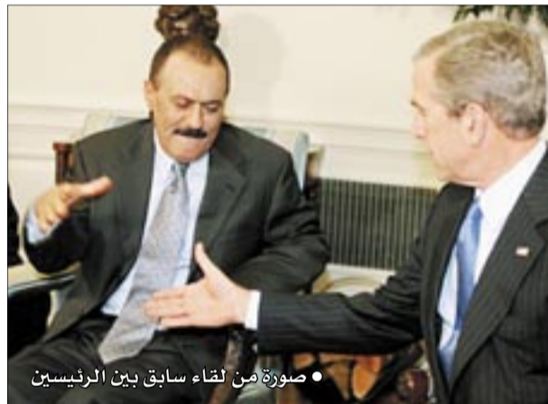
• صورة من لقاء سابق بين الرئيسين

يستقبل الرئيس الأمريكي جورج دبليو بوش اليوم في البيت الأبيض الرئيس علي عبدالله صالح، الذي وصل إلى واشنطن أمس الأول أصلاً في تجاوز عتبة صندوق الألفية في مقابل المزيد من التعاون في مجال مكافحة الإرهاب.