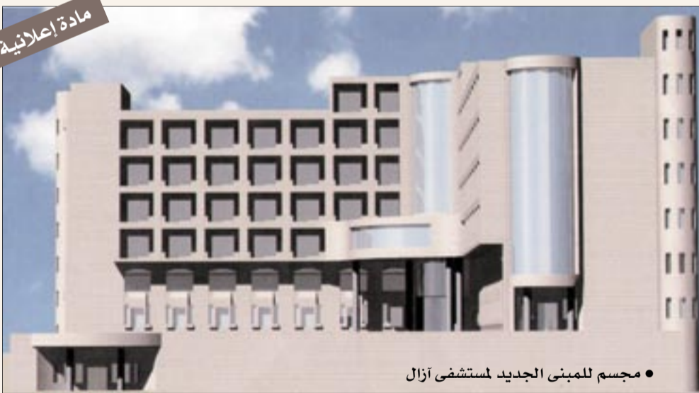
• مجسم للمبنى الجديد لمستشفى أزال